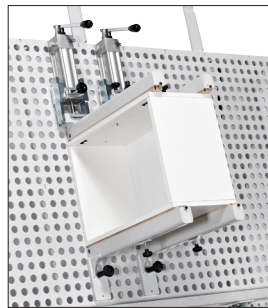
Rozšírenia pre montáž častí nábytku.