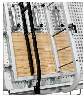
Pevná a posuvná predná svorka.