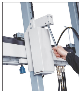
Praktický systém na uvoľnenie a umiestnenie valcov