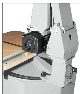
Nastavitelná základňa kyvadla